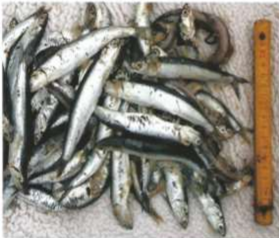
Anchois ( Engraulis japonicus ) (Taille Moyenne 11cm)