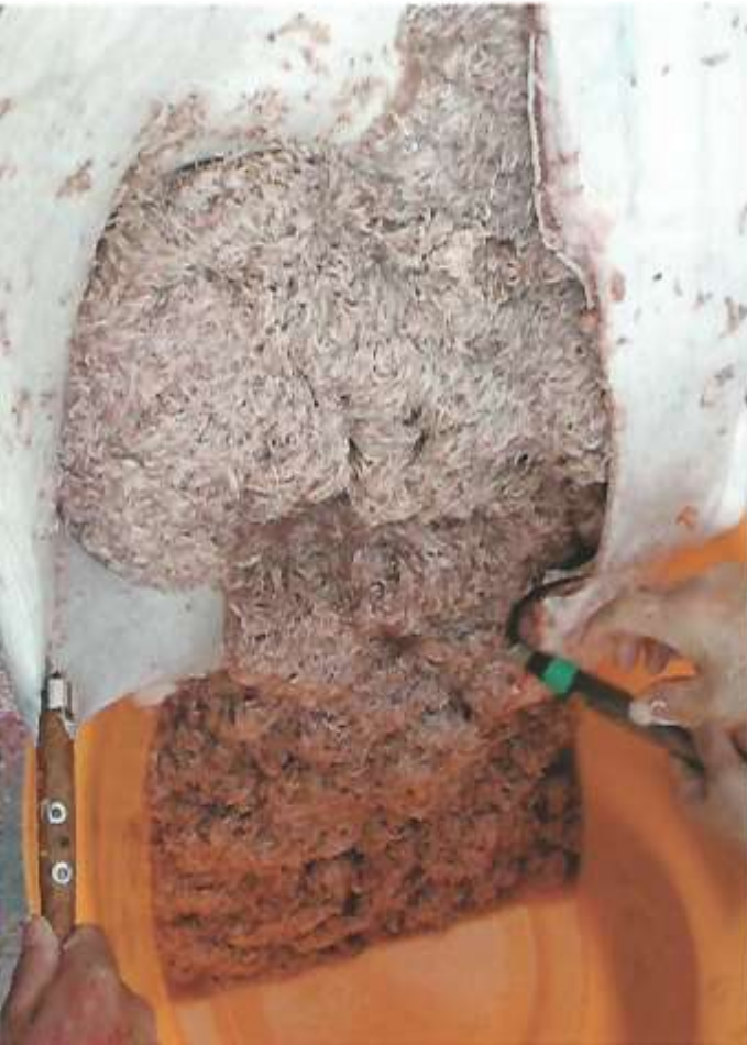
Krill ( Euphausia pacifica )