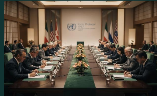
Protocole de Kyoto, 1997

Premier grand rendez-vous politique mondial sur l'environnement, il pose les bases de la CCNUCC et du principe de responsabilités communes mais différenciées