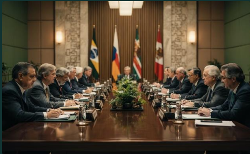
Sommet de la Terre, Rio 1992

Premier grand rendez-vous politique mondial sur l'environnement, il pose les bases de la CCNUCC et du principe de responsabilités communes mais différenciées