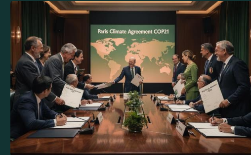
Accord de Paris, 2015

Premier traité contraignant sur les émissions de gaz à effet de serre – un symbole fort, malgré ses limites et le retrait des États-Unis en 2001